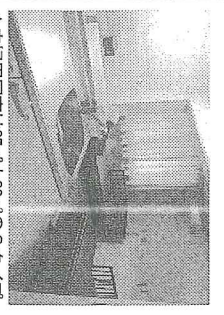
▲夫専用居室は25㎡と30㎡の2タイプ

大阪府は全部道庁県庁でも用意する。11月5日から入居が開始となり、現在まで最も多いが、泉南市で11月中に10戸の契約を目標としており、半年以内での満室を目指しているという。